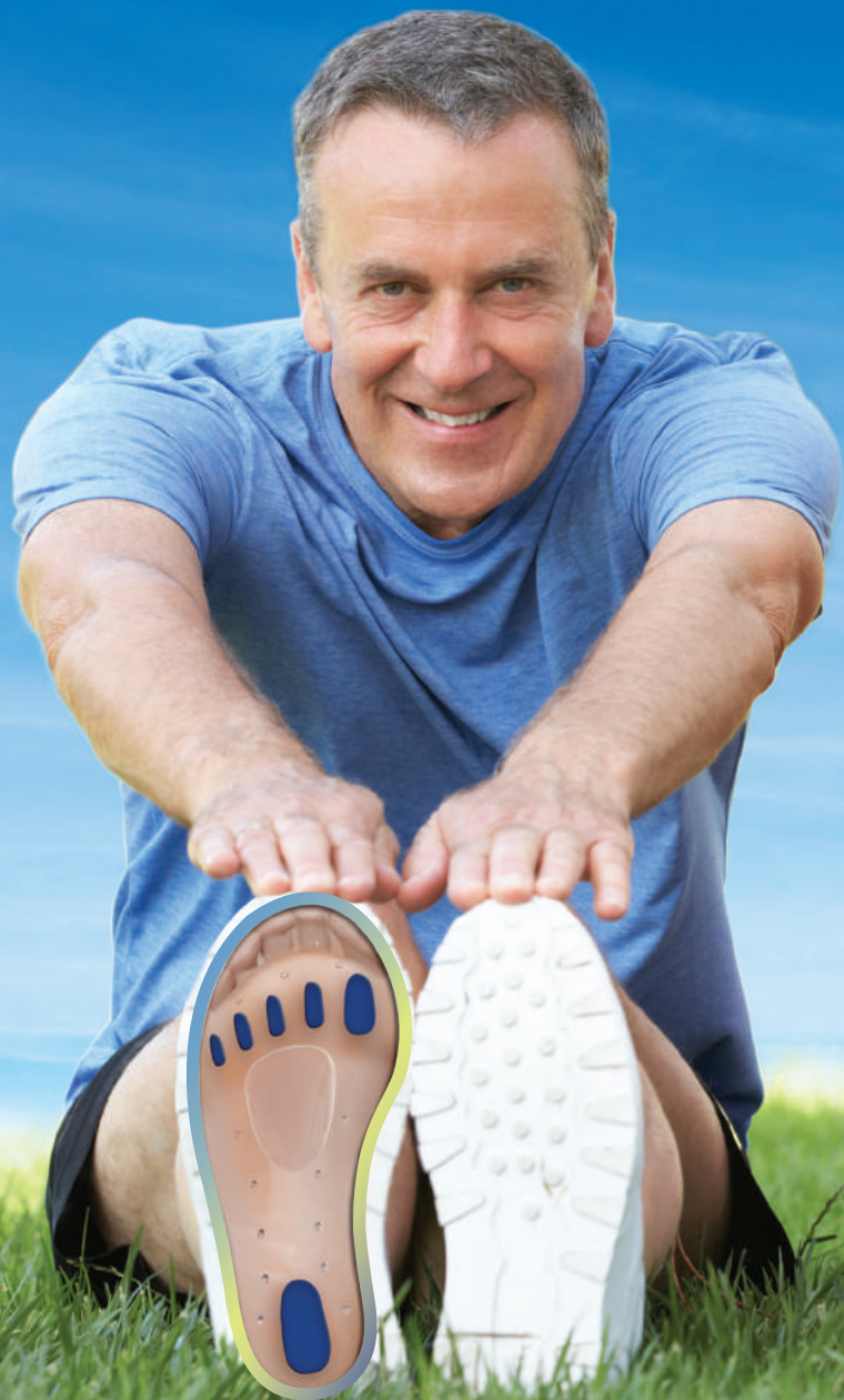
PLANTILLAS DE GEL