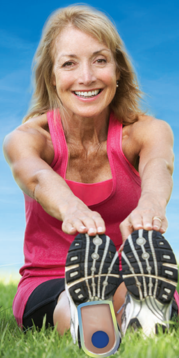
TALONERAS DE GEL