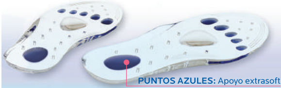
PUNTOS AZULES: Apoyo extrasoft